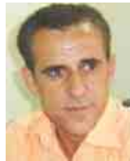
بەرھەفکر: بلند محەمەد

ژیانا مرقۆقیەتی پشکداریەکا مەزن دفا مکرنا تیکەلیین ھزری ب ھەبوونی را ھەبوویە، کو ھەر تشت ژ مرقۆقی دەسپیکە، سارتر دبیژە: " ھەبوونا مرقۆقی بەری پیناسەکرنا خوہ دەیت " ئانکو مرقۆقی دەسپیکە ھەبوویە، بەریا ھەر تشتەکی ژنی ھەمبەری خوہتیا خوہ دبه و پاشی دکەفە ناڤ جیھانی و پشتی ھینگێ خوہ ناس دکە.