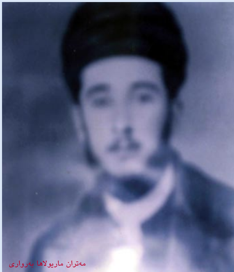
مهتران ماریولاها بەرواری

و ژ بو ئامادهبوونا کۆمیونیت ( جقاتا شۆرهشی ) و ژبو دیتا مهلا مستهفا بارزانی هەمی سالان ( چوار ) جارن مهتران ماریولاها ژ بەرواری بالا د چووو ناوپردان و گلاله و دیلمان ... و ژ بو قی یهکی ((مهتران ب هیسترا د چوو دهقەرا نیروه و ژ ویری بو گوندیت دۆسکی ژووری و ژویری بو گوندیت مزووری ژووری و بارزان و ریزان و دیلمان و ناوپردان)) ..