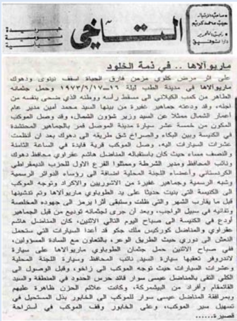
هندهک ژ گو تارا روژناما (التاخی) یا روژا ۲۷ / ۶ / ۱۹۷۳ ل دور ری وره سمیت قه گوهاسنتا جهنازی مهترانی بۆ کوردستان

— ب راسپاردا بارزانی نه مر پيشوازیه کا گهرم و گور ل جهنازی وی ل فهیدی و زاخو هاته کرن ... و عهلی شنکالی وهک نوینه ری سهروک بارزانی نه مر و نعمان عیسا بارزانی و عهبدو لغه فار صائغ جیگری پاریزگاری دهوکی و گورگیس مهلک جکو سهروکی لیژنا بالا یا مهسیحیا و قایمقامی قهزا زاخو و عیسی سوار ئامر هیزئ زاخو و مه تران یوسف بابانا ئەلقوشی مهترانی مهترانی کلدان ل زاخو و سهلیم ئەسهده خو شهقی ئامر هیزئ ئامیدی و ئەحمده شالی قایمقامی قهزا ئامیدی و فازل میرانی وهک